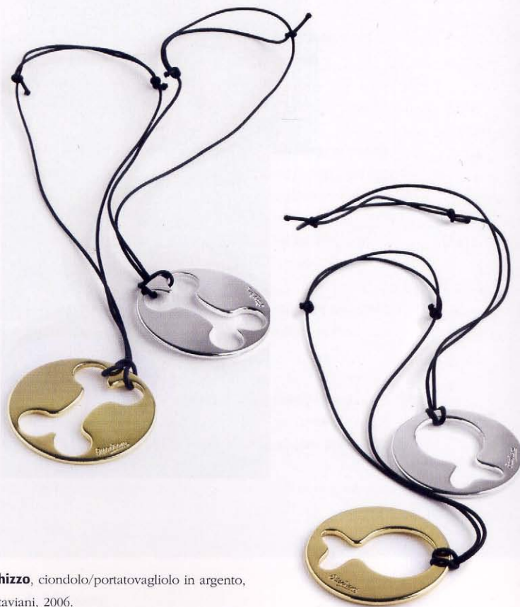
Schizzo , ciondolo/portatovagliolo in argento, Ottaviani, 2006.

Lo studio percorre da subito sentieri rivolti a una tensione continua alla ricerca dell'emozione e del dialogo, elaborando curiose miscele di realtà e invenzione. Un volo che porta l'architetto e la designer, guidati da istinto fanciullesco, a intraprendere il viaggio delle sperimentazioni occupandosi di architettura, interior design, industrial design, grafica, ideazione e organizzazione eventi per fiere e spazi espositivi. Dinamicità, trasformabilità e versatilità, ironia e gioco sono le caratteristiche percepibili in ogni progetto, dove progettare e sognare procedono da sempre insieme. EF